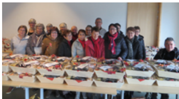
L'équipe de bénévoles

Au mois de décembre, 325 Héricois ont reçu un coffret gourmand remis par des bénévoles. 141 personnes ont choisi le repas des aînés et se retrouveront le 11 mars prochain à l'Espace des Bruyères.