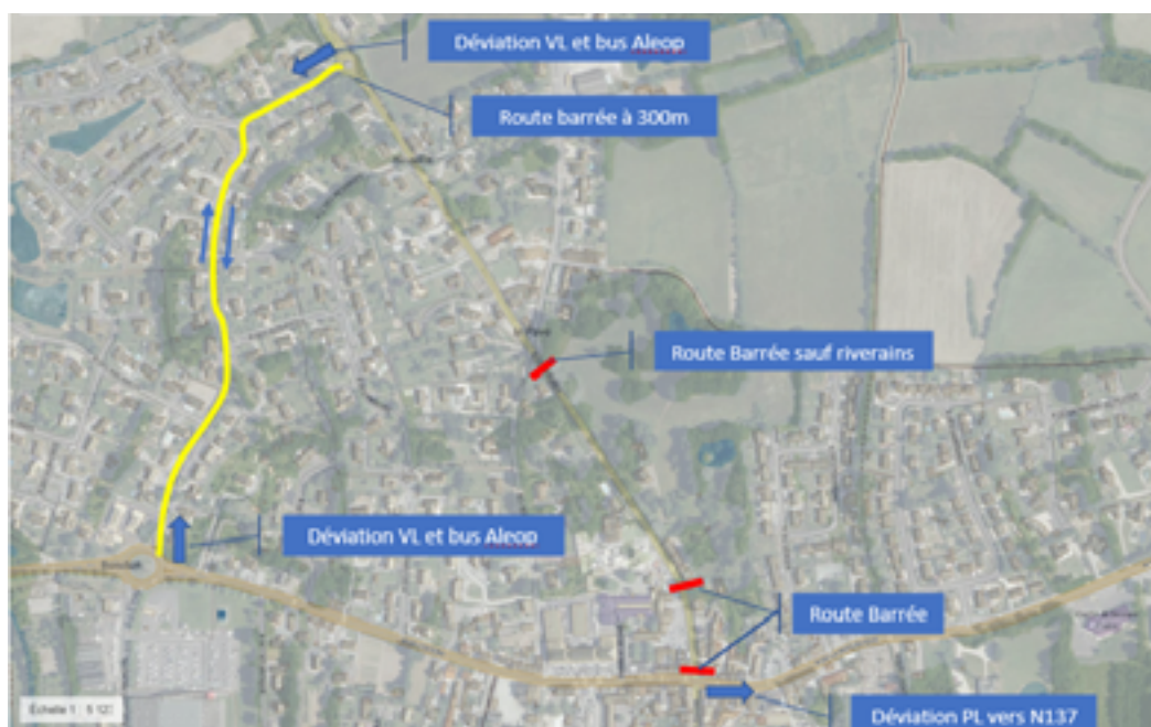
Plan de déviation des véhicules légers

Conscients des désagrèments durant cette période, le service assainissement collectif reste à votre disposition pour tout renseignement complémentaire par mail assainissement-collectif@cceg.fr ou par téléphone 02 28 02 01 05 .